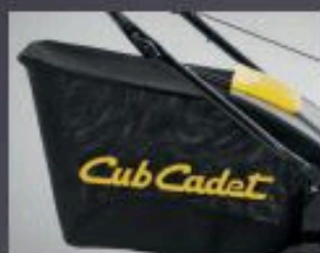
GRAND BAC DE RAMASSAGE