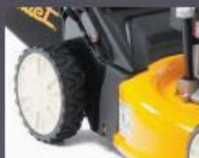
ROULEMENTS À BILLES DOUBLES