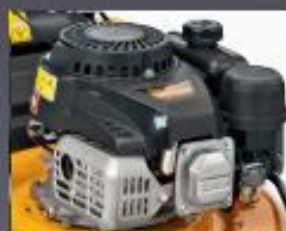
MOTEUR PUISSANT OHV CUB CADET