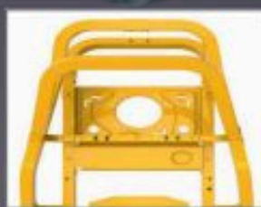
CHÂSSIS TUBULAIRE 50X50 MM