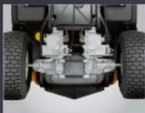
DOUBLE TRANSMISSION HYDROSTATIQUE