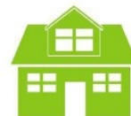
Résidence & Habitation

10 rue des Pâtures 10120 Saint-Pouange TEL : 03 25 42 08 34 MAIL : contact-mdsequipements@orange.fr