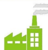
Site Industriel & Collectivité